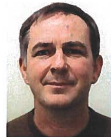
Lichtbild verantwortliche Elektrofachkraft